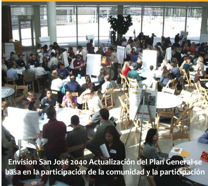
Envision San José 2040 Actualización del Plan General se basa en la participación de la comunidad y la participación